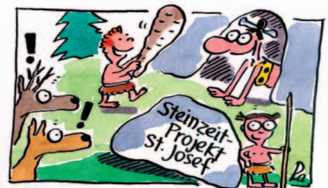
Illustration: Cartoon von Renate Alf, „Der reinste Kindergarten“, Lappan Verlag, 8,95 Euro.